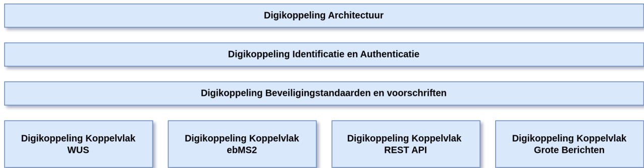
Figuur 1 Onderdelen Digikoppeling specificatie

Deze onderverdeling komt ook terug in de documentatie van de Digikoppeling standaard. Het volgende hoofdstuk behandelt de beschikbare documentatie en geeft per document aan wat de inhoud is.