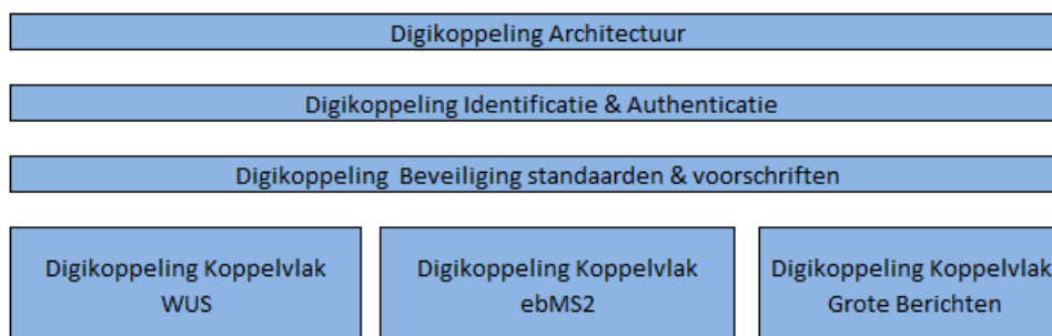
Figuur 1 Onderdelen Digikoppeling specificatie

De onderstaande figuur geeft de verschillende onderdelen van de digikoppeling standaard weer: